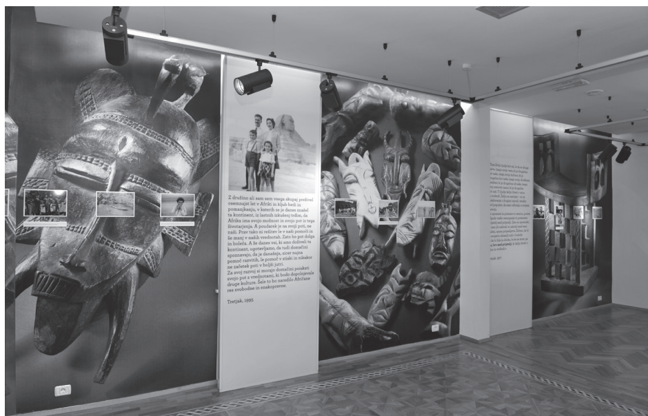
Stalna razstava Brv med prijatelji , Tretjakova afriška zbirka, 2012